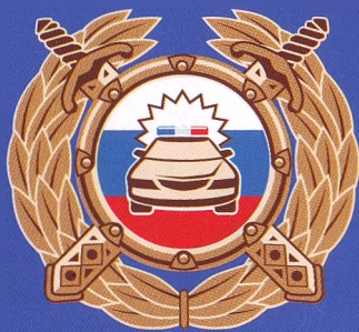
Госавтоинспекция МВД России

Буклет изготовлен по заказу Минпросвещения России в рамках реализации федеральной целевой программы «Повышение безопасности дорожного движения в 2013–2020 годах».